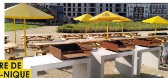
L'AIRE DE PIQUE-NIQUE