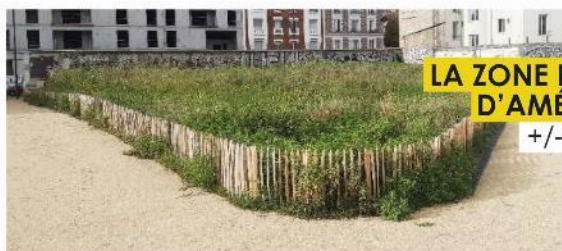
LA ZONE EXPÉRIMENTALE D'AMÉNAGEMENT